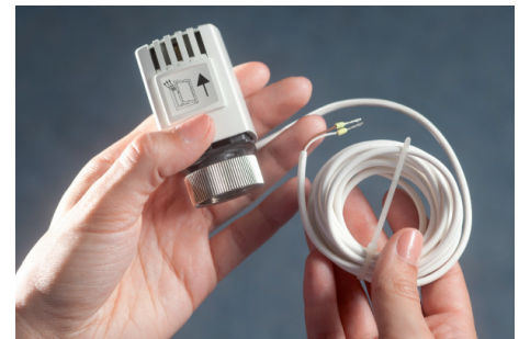
Regelungstechnik für Heizkörper