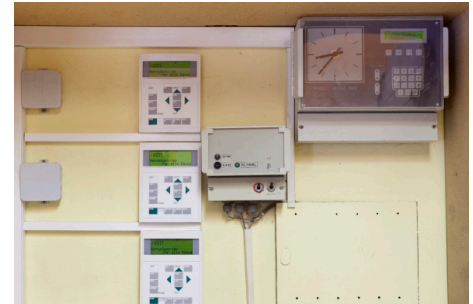
Zentrale zur Regelung der einzelnen Räume

In der Lichtenberger „KULTSchule“ kommt seit der Modernisierung neuartige Regelungstechnik zum Einsatz. Messgeräte erfassen digital die aktuelle Raumtemperatur und überwachen online den einwandfreien Betrieb der Anlage. Sie erkennen z. B., ob Fenster geöffnet sind und regeln die Heizungsanlage dementsprechend ein. Gleichzeitig hat der Hausmeister jederzeit die Möglichkeit, die eingestellte Temperatur und die Heizungszeiten zu ändern. Die intelligente Regelung ermöglicht eine individuelle Temperatureinstellung einzelner Räume. In leerstehenden Räumen hält das System eine festgelegte Temperatur und vermeidet auf diese Weise Feuchtigkeitsschäden. In Schulen, Veranstaltungszentren oder Hotels kann mit dieser Technik die Raumtemperatur via Stunden-, Belegungs-, Ferien- und Arbeitszeitplan gesteuert werden.